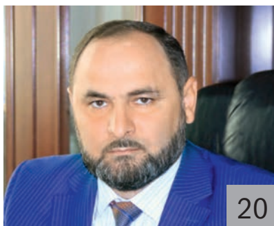
С. Х. ТАГАЕВ, заместитель председателя Правительства Чеченской Республики — министр финансов