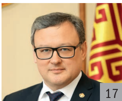
М. Г. НОЗДРЯКОВ, первый заместитель председателя Кабинета министров Чувашской Республики — министр финансов