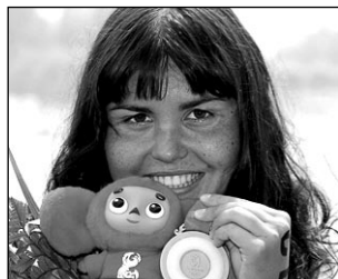
ЗОЛОТО Лариса ИЛЬЧЕНКО, плавание, 10 км открытая вода