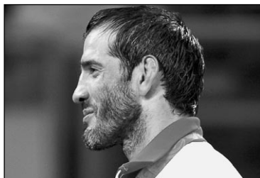
ЗОЛОТО Бувайсар САЙТИЕВ, вольная борьба, 74 кг