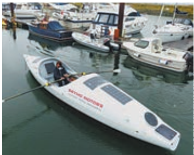
Лодка, на которой Конюхов хочет переплыть Тихий океан.

Переход через Тихий океан на веслах – очередной вызов Федора устоявшимся представлениям о возможностях человека. Подобное путешествие еще никому не удавалось. Особенно сложным обещает быть финишный отрезок,