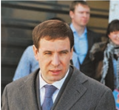
Губернатор Челябинской области Михаил Юревич.

Итак, погадаем. Этот шокирующий тендер «висит» на сайте госзакупок. Там черным по белому сказано, что «государственный заказчик,