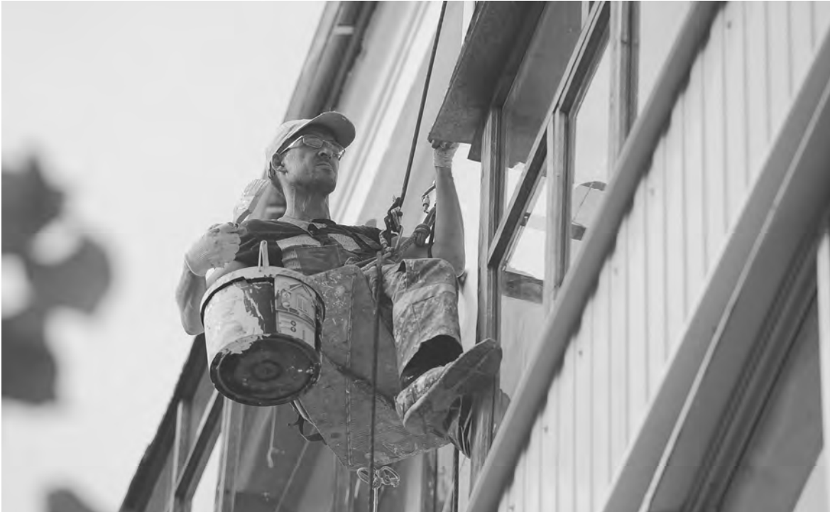
АЛЕКСАНДР РОМНИН / ТАСС