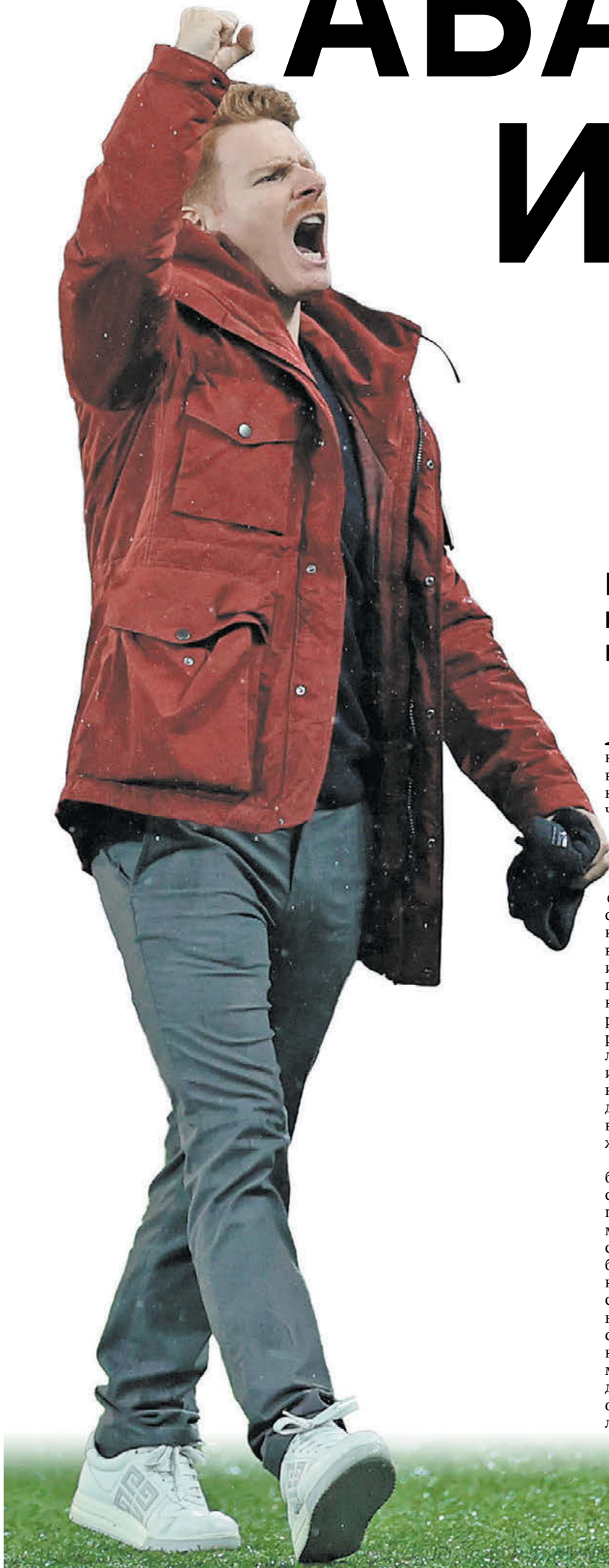
Главный тренер «Спартакa» Гильермо Абаскаль