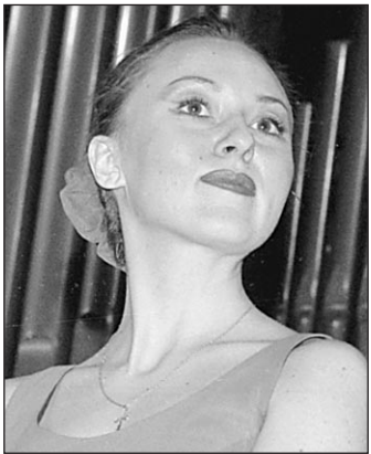
чем. Там возраст такого значения уже не имеет.

— Главное, что налоговые службы впервые смогут наказывать не хозяйства в целом (то есть крестьянскую общину, если называть вещи своими именами), а их руководителей, которые в последнее время были вне контроля, в том числе и рыночной. Они продавали продукцию «налево», а разница «черным налогом» делилась между пе-