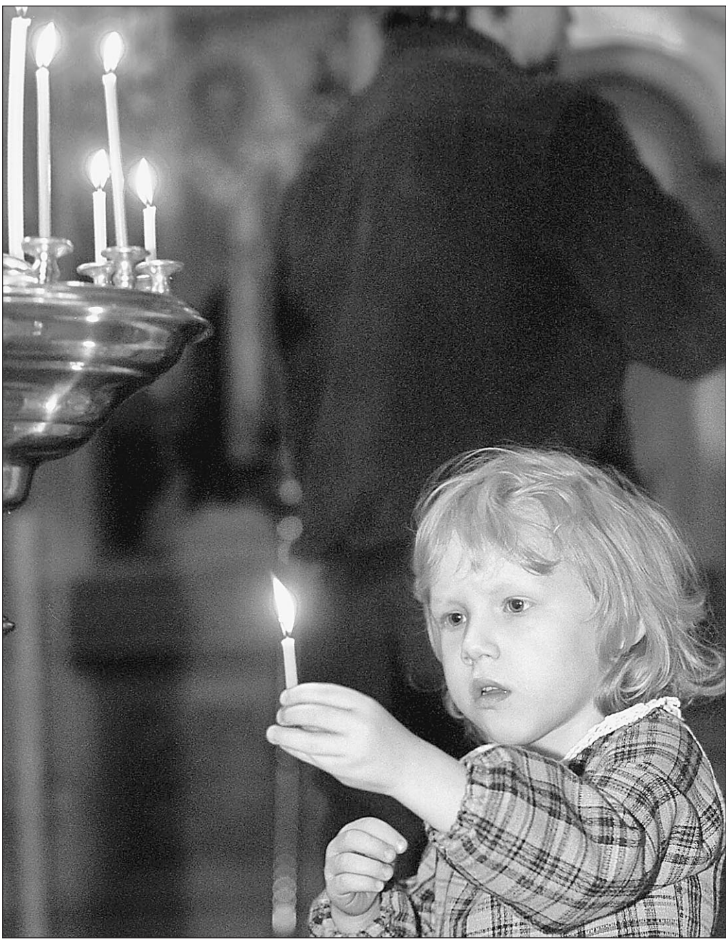
Прощание с Человеком

Атмосфера насилия, которую создает жестокое государство, намного страшнее самого бытового насилия. Все, что у нас есть, — это мы. Ценность жизни каждого человека перевешивает все достижения государственного строительства. Мы как умеем защитим себя сами. А государство пусть защищает нас тем, что тратит деньги на новые рабочие места и детские спортивные школы. Пусть судит преступников по закону. Тем более, что законы есть и заставить их работать может только власть. И еще пусть у нас будет шанс реализовать себя. В нашей жизни. В наше время. В нашей стране.