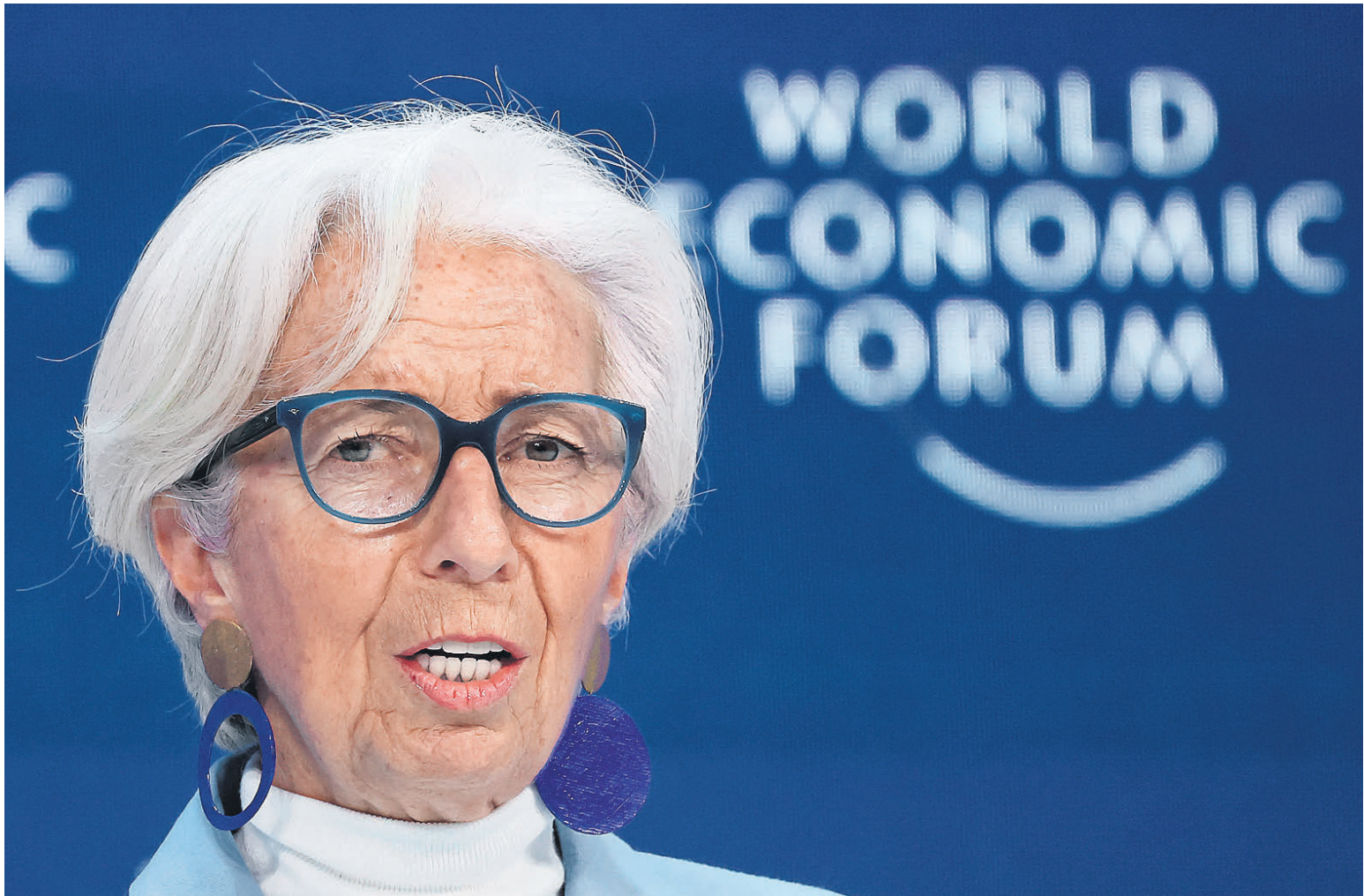
Глава ЕЦБ Кристина Лагард на форуме в Давосе отметила замедление инфляции в еврозоне, но воздержалась от прогнозов по уровню ставок

Кристина Лагард подчеркнула, что по итогам 2023 года можно констатировать адаптацию экономики к новым «правилам игры», коррективы в которые все еще вносят усиление геополитических рисков, ослабление рынка труда и сокращение накопившихся у граждан во время пандемии избыточных сбережений. Речь при этом идет