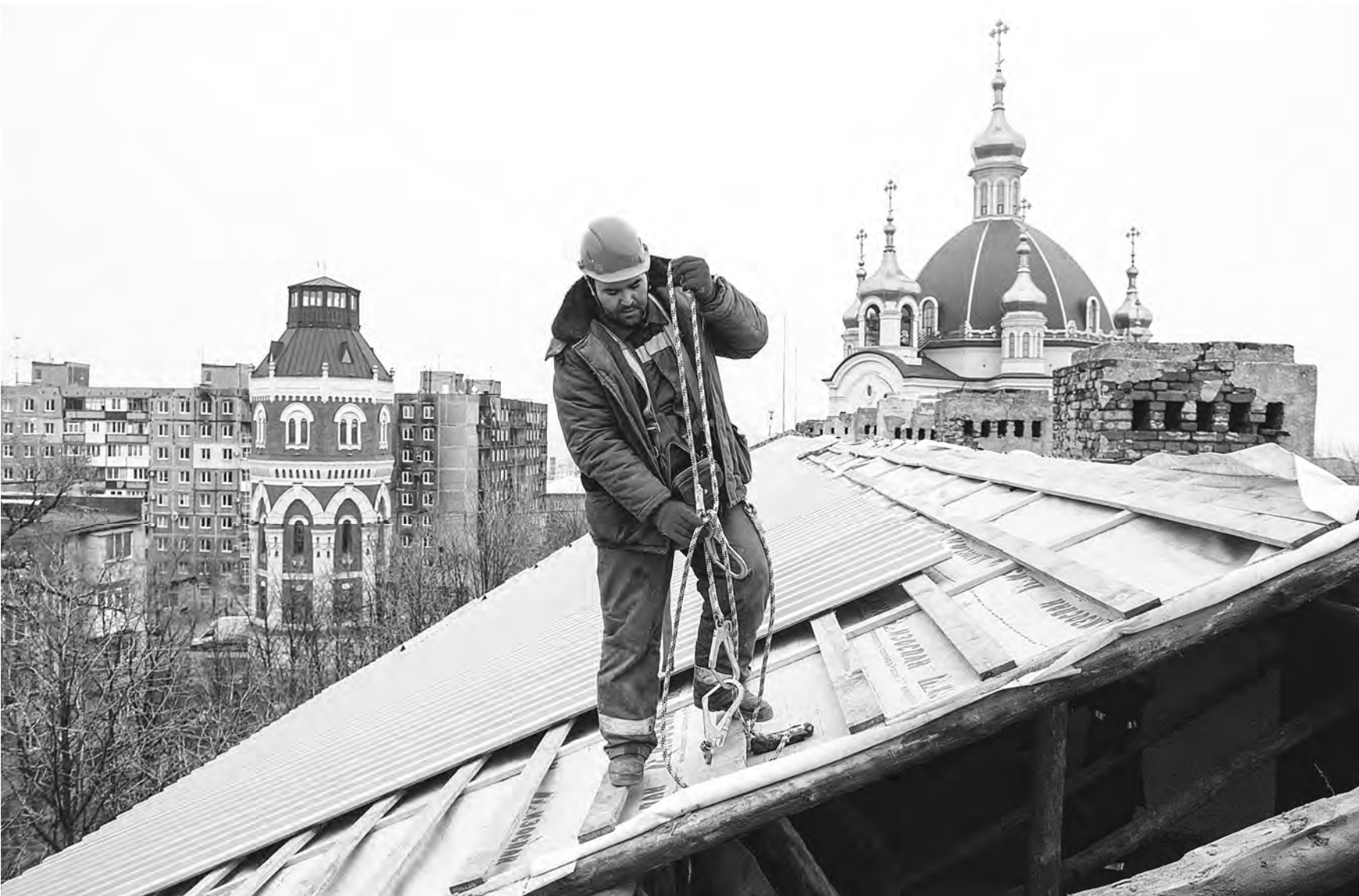
ВЛАДИСЛАВ МАНУИЛОВ / УРА.НОВОСТИ