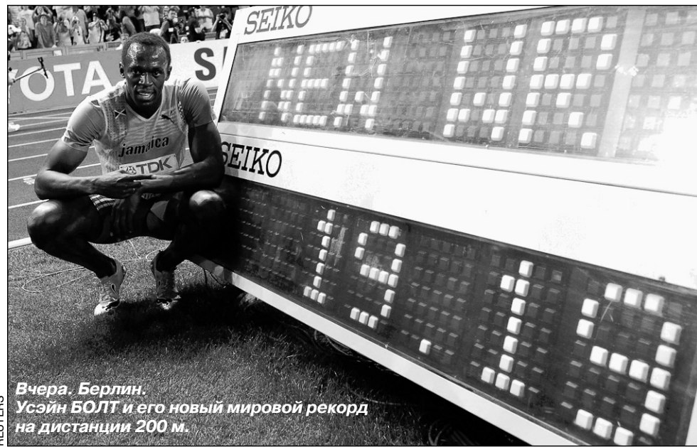
Вчера, Берлин. Усэйн БОЛТ и его новый мировой рекорд на дистанции 200 м.

Вчера трехкратный олимпийский чемпион Усэйн Болт стал двукратным чемпионом мира, выиграв финал двухсотметровки с очередным невероятным мировым рекордом 19,19