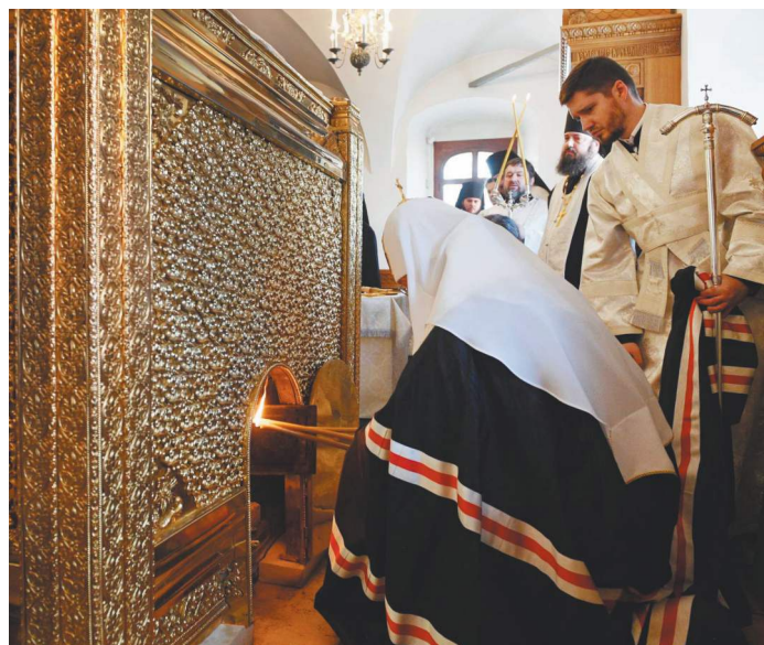
ПРЕСС-СЛУЖБА ПАТРИАРХА МОСКОВСКОГО И ВСЕЙ РУСИ