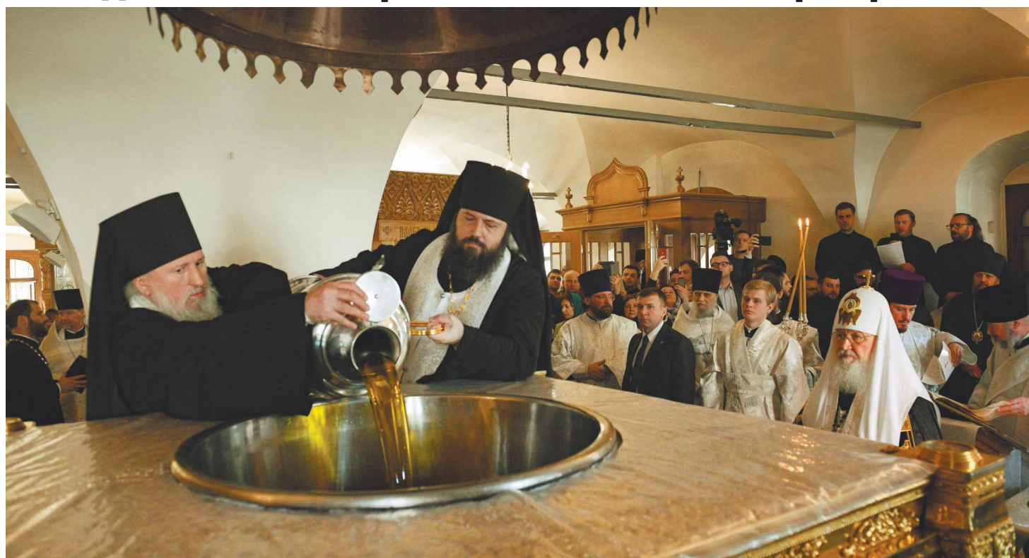
ПРЕСС-СЛУЖБА ПАТРИАРХА МОСКОВСКОГО И ВСЕЙ РУСИ

В Донском монастыре Москвы начался чин мироварения