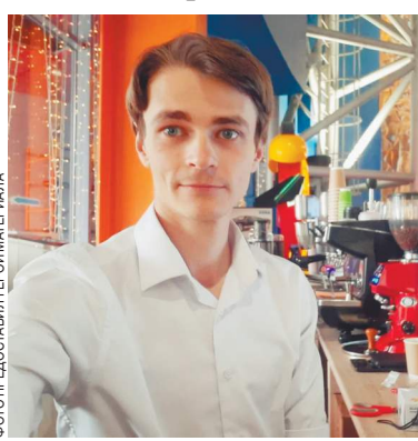
ФОТО ПРЕДСТАВИТЕЛЯ ПЕРИОДИКА

Человек, который провел в тайге 20 лет, рассказал о жизни среди людей