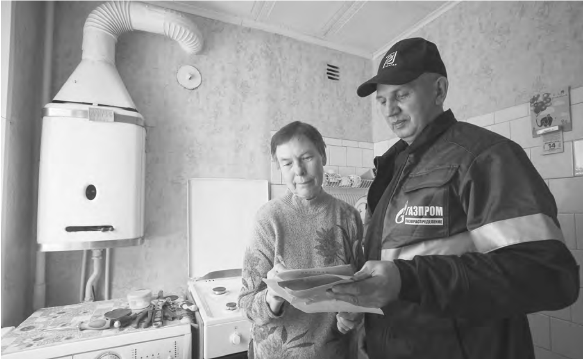
АЛЕКСАНДР РОМНИН / ТАСС