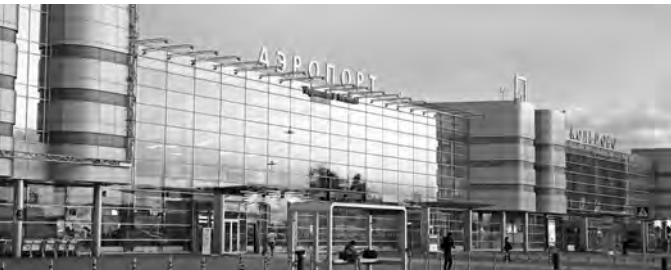
Аэропорт Кольцово в Екатеринбурге назовут в честь Акифия Демидова.