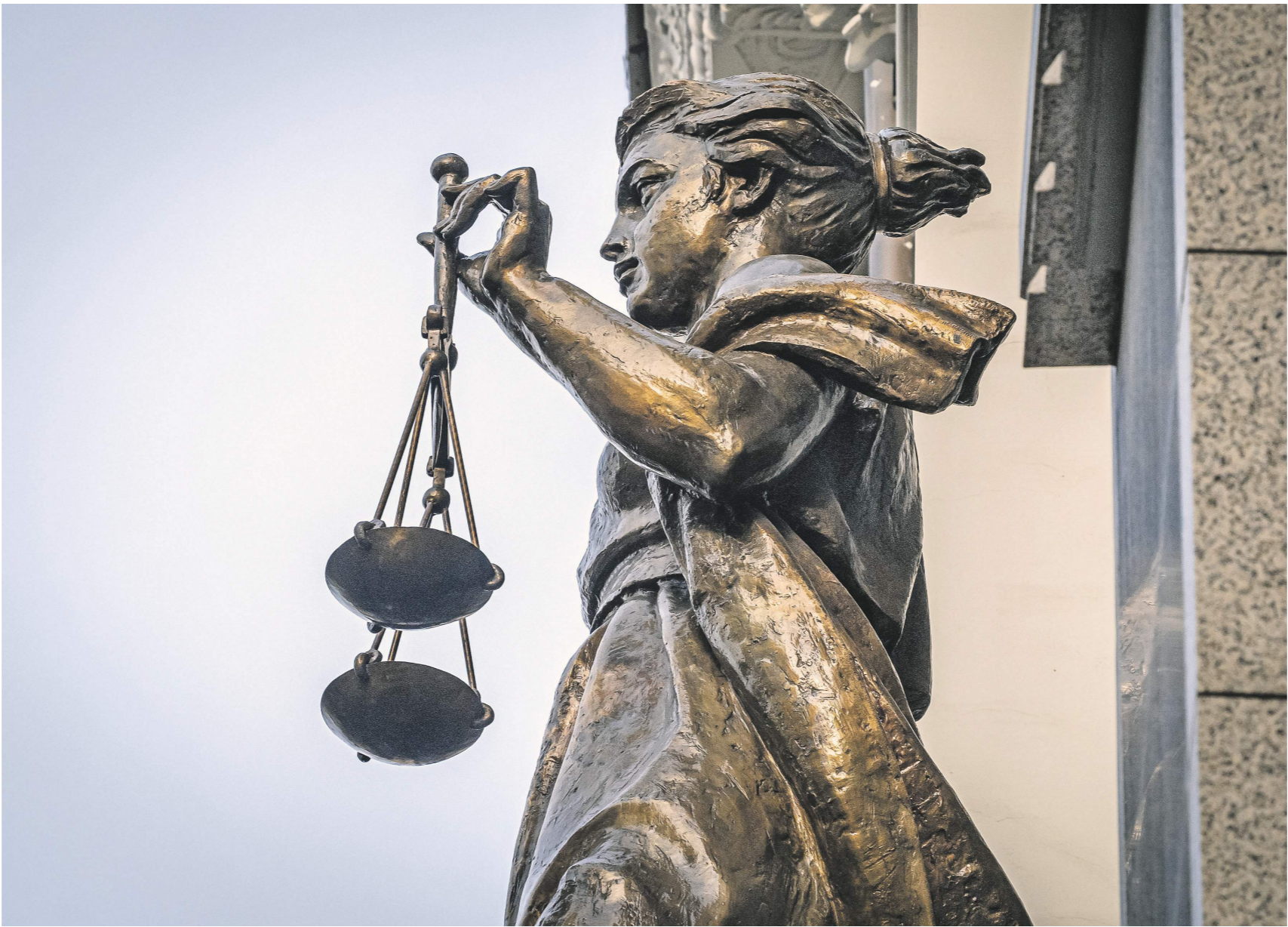
Константин Козловский / «Известия»