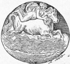
L'enlèvement d'Europe 1 .