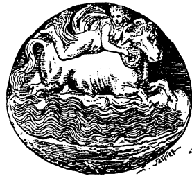
L'enlèvement d'Europe 1 .

Hérodote, qui naquit au milieu des guerres Médiques, en 484, étonné de ce grand choc du monde grec et du monde barbare, en chercha les causes par delà la guerre de Troie, jusqu'aux temps mythologiques. Il n'est pas nécessaire de remonter si haut, ni de rappeler Io et Hélène ravies par des Asiatiques, Europe et Médée enlevées par des Grecs, pour expliquer la haine de deux mondes. La fuite du médecin Démocédès, qui trompa Darius afin de revoir Crotone sa patrie, et le désir de la reine Atossa d'avoir parmi ses esclaves des femmes de Sparte et d'Athènes ne sont que de puérils incidents. Les instances d'Hippias pour être rétabli dans Athènes, celles des Aleuades de Thessalie pour être délivrés d'adversaires qui les gênaient, eurent une influence plus sérieuse. Mais la vraie cause fut la puissance même de la Perse. Cet empire avait alors atteint ses limites naturelles. Partout il était enveloppé par des déserts, la mer, de grands fleuves ou de hautes montagnes. Il ne pouvait plus s'étendre que d'un seul côté, au nord-