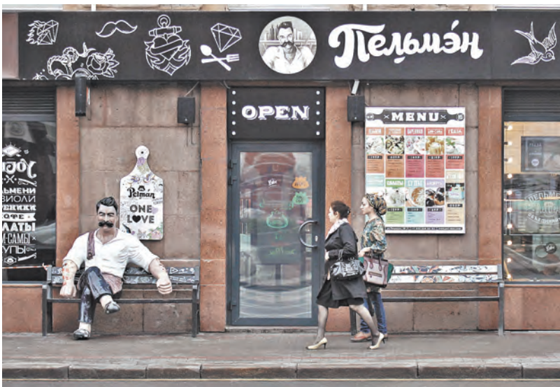
Сейчас многие западные фирмы ищут специалистов со знанием русского языка.

рый за эти годы расширил свою географию и стал международным. Более пяти тысяч человек из 20 стран были его участниками, 650 из них стали лауреатами. По традиции, са-