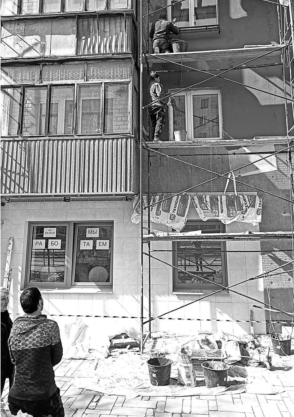
Судебный иск от прокуратуры стимулирует исполнителей гораздо больше, чем строчка в областной программе.

А вот для ремонта фасадов двух объектов культурного наследия «Доходный дом» на Венцека, 38 и «Дом на усадьбе купцов Плотниковых» на Ленинградской, 103 достаточно было представления в адрес директора Фонда. Здания уже покрасили, восстановили конструктивные элементы. В Тольятти прокуратура подала иски по завершению начатых, но брошенных капремонтов на 11 многоквартирных домах. Суд обязал Фонд доделать работы. В итоге на двух домах уже капитально починили кровли, по остальным к делу подключились судебные приставы. По мнению прокуратуры, несвоевременные ремонты стали в том числе результатом ненадлежащего контроля за подрядчиками со стороны Фонда. Напомним, ранее регоператор сетовал, что подрядчики не выходят на торги в том числе из-за низких расценок за работы и щадящих тарифов для населения.