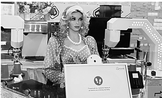
Гостеприимная Дуняша ждет гостей ежедневно 24 часа в сутки.

Компания «Промобот» совместно с компанией «Робин Гуд Роботикс» представили проект «Киберкафе «Дуняша». Робот-кассир с модельной внешностью предлагает мороженое, газировку, кофе и быстрое обслуживание. Во время ожидания заказа Дуняша поддерживает приятный разговор, расскажет сказку или предложит сделать селфи. Первые кафе появятся в парке имени Горького города Перми и у колеса обозрения в Нижнем Новгороде.