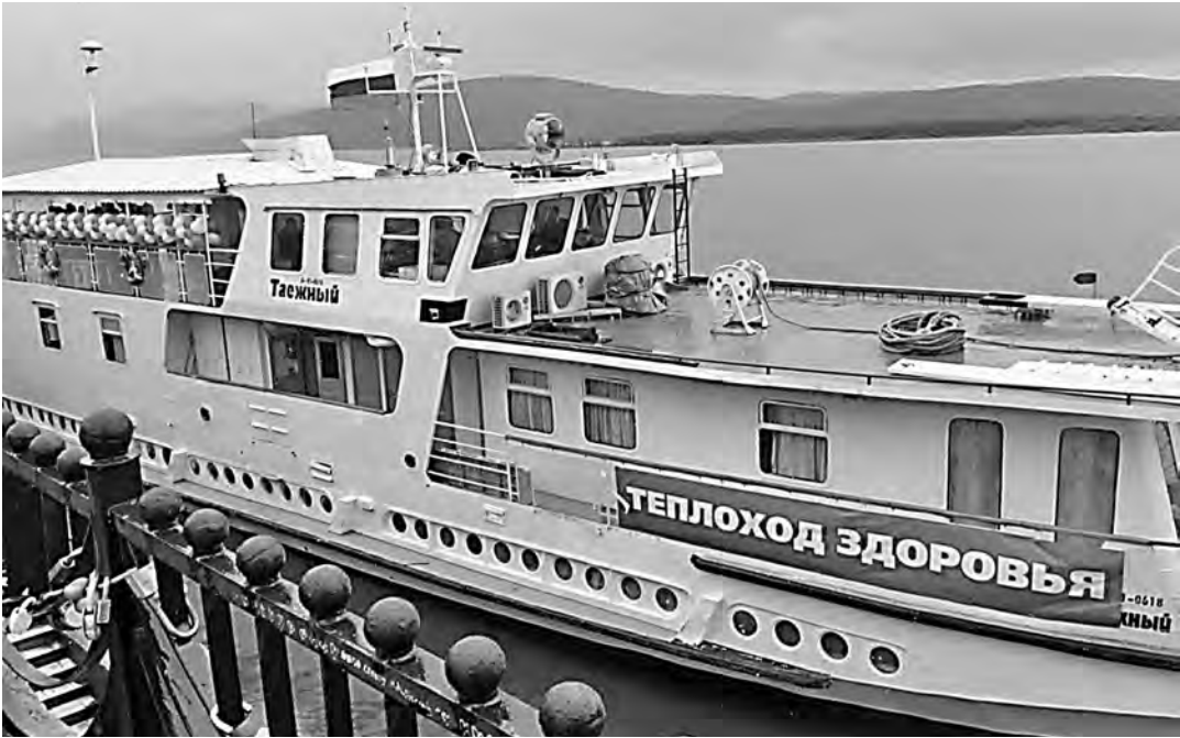
ПРЕСС-СЛУЖБА ПРАВИТЕЛЬСТВА ХАБАРОВСКОГО КРАЯ