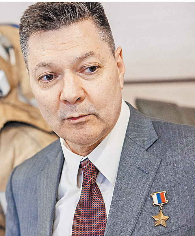
Олег Кононенко: Космонавт сегодня — универсал. Управляем кораблями, ремонтируем, делаем эксперименты. По сути, мы глаза, руки, уши ученых.