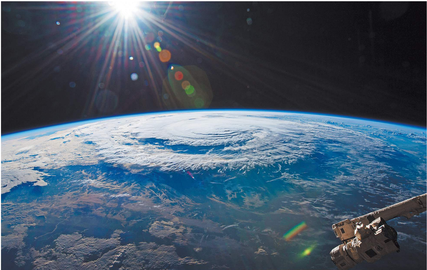
Земля в иллюминаторе. Такой фантастически красивой видит нашу планету экипаж Международной космической станции.