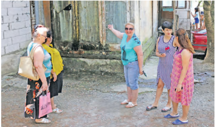
Здание не пригодно для жизни, но жильцам некуда переезжать.