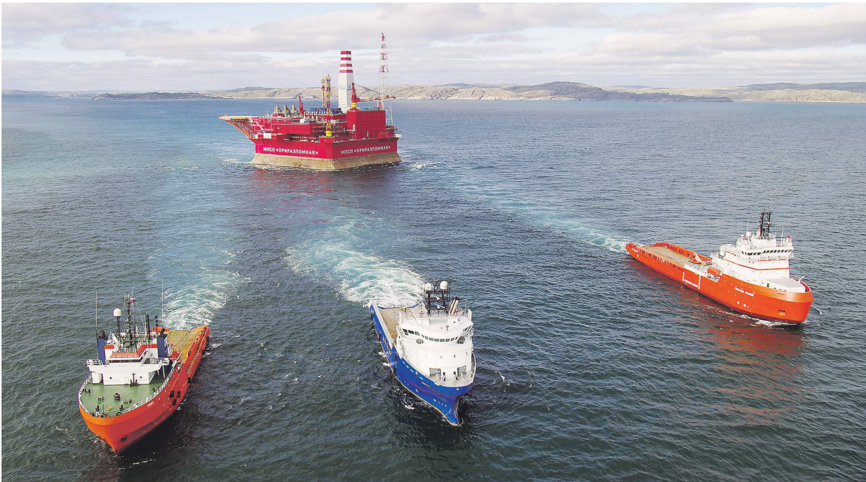
Добыть дополнительно 200 тысяч баррелей нефти в сутки не представляет для России никакой проблемы | ТАСС | Максим Воркунов

Сейчас квота для не входящих в ОПЕК стран, к которым относится и Россия, составляет 57,3 млн баррелей. Нефтедобыча, по оценке ОПЕК,