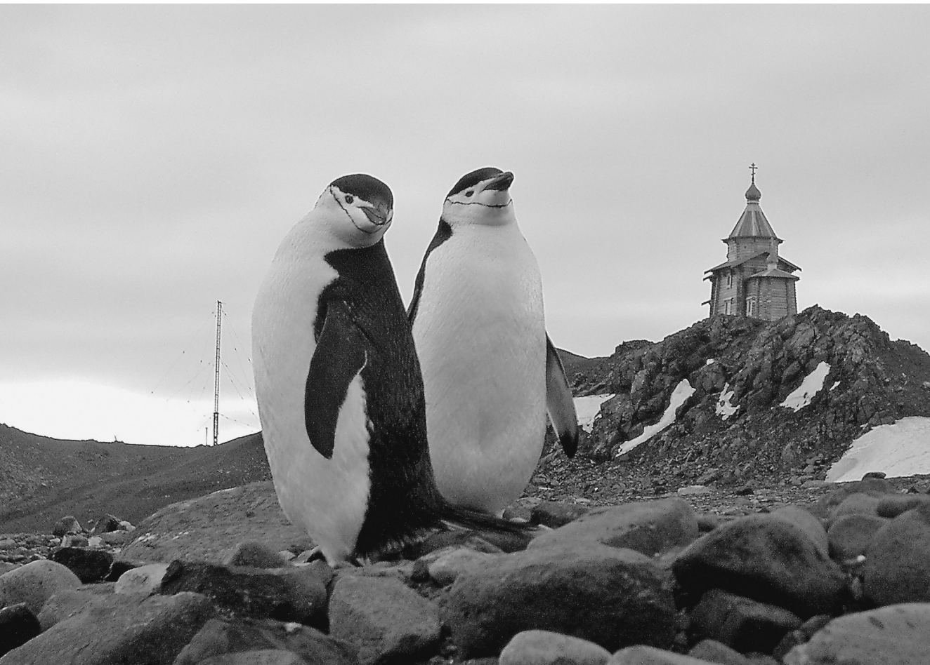
Почти 200 лет русского присутствия в Антарктиде подготовили туземцев к туристическому буму

Шутливая новость была многими воспринята всерьез потому, так как была тщательно замаскирована под настоящий пресс-релиз, сообщающий о событиях, для многих вероятном. В релизе среди прочего говорилось о выполнении комплекса работ по подготовке антарктических аэродромов и инфраструктуры для размещения путешественников на российских