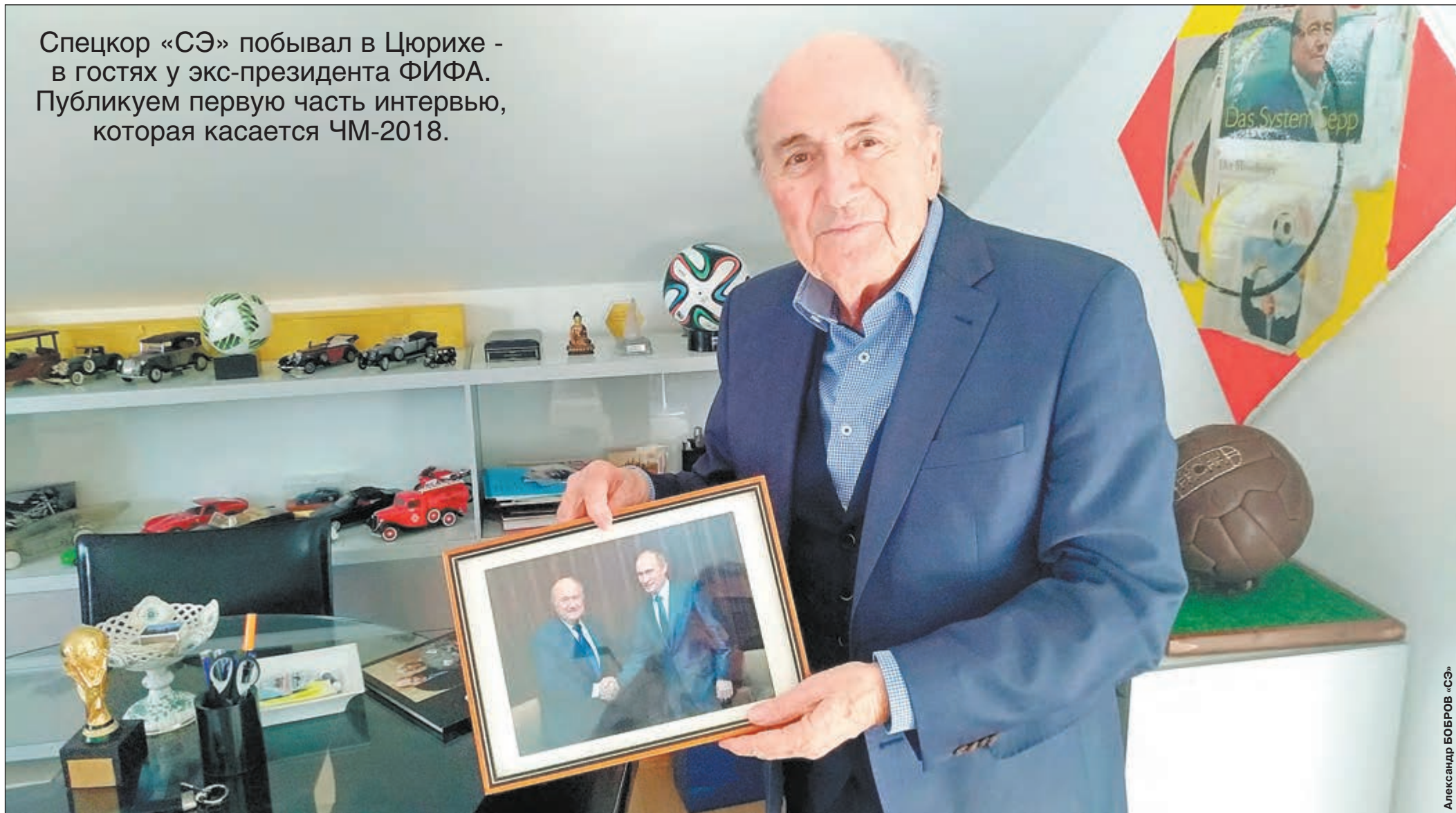
Март. Цюрих. Йозеф БЛАТТЕР демонстрирует одну из своих самых ценных фотографий, на которой он запечатлен с Президентом России Владимиром Путиным.

Спецкор «СЭ» побывал в Цюрихе - в гостях у экс-президента ФИФА. Публикуем первую часть интервью, которая касается ЧМ-2018.