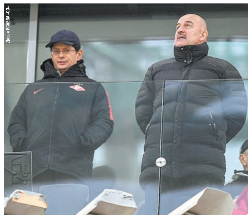
Воскресенье. Москва. Тушино. «Спартак» - «Арсенал» - 2:3. Владелец «Спартак» Леонид ФЕДУН и главный тренер сборной России Станислав ЧЕРЧЕСОВ (справа) на трибуне.