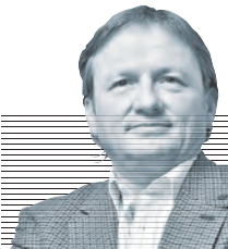
Борис Титов: Повышение ставки рефинансирования мы считаем неправильным.

НУЖНО ВСЕ ПРЕДЛОЖЕНИЯ, КОТОРЫЕ У НАС ЕСТЬ, ОБЪЕДИНИТЬ В ПРОГРАММУ, СТРАТЕГИЮ РАЗВИТИЯ ЭКОНОМИКИ СТРАНЫ, ГДЕ БУДУТ ЗАФИКСИРОВАНЫ КОНКРЕТНЫЕ ЭКОНОМИЧЕСКИЕ ПОКАЗАТЕЛИ