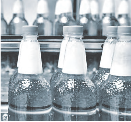
Отмена запрета спасла производителей пластиковых бутылок.