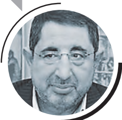
ХУСЕЙН ХАДЖ ХАСАН, МИНИСТР ТОРГОВЛИ И ПРОМЫШЛЕННОСТИ ЛИВАНСКОЙ РЕСПУБЛИКИ

Экономические связи Ливанской Республики с Россией получили новый импульс в связи с состоявшимися в декабре 2014 года российско-ливанским Деловым форумом в Москве и бизнес-миссией предпринимателей Ливана в Московскую область. Ассортимент российских поставок в Ливан весьма широк: это прежде всего нефтепродукты, зерновые, деловая древесина, стройматериалы. Считаю, что экспорт из России в Ливан — примерно 160 миллионов долларов в год — вполне может увеличиться, поскольку ливанский спрос на многие российские товары остается высоким. А ливанская сторона могла бы существенно нарастить поставки в РФ, например, сельхозсырья и готового продовольствия. В первую очередь свежие яблоки, по-