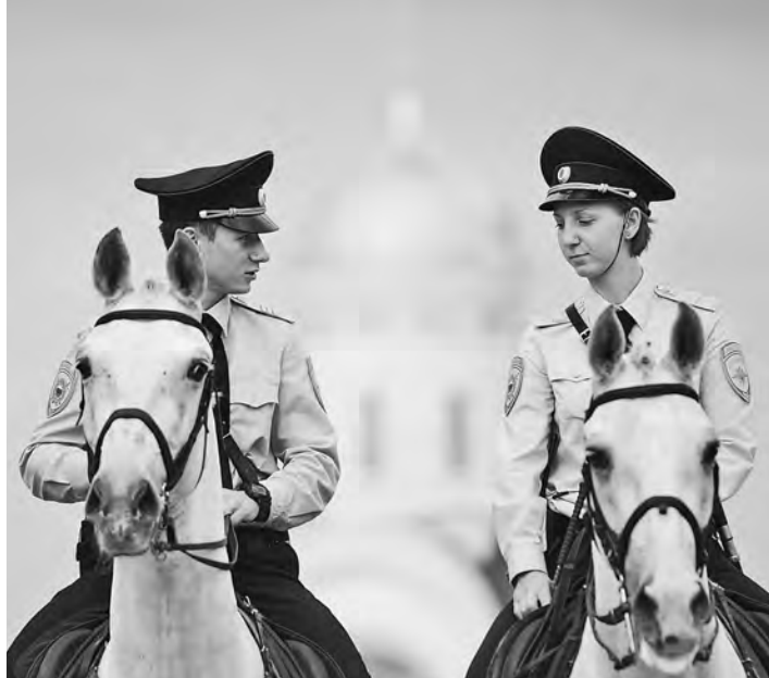
Глава МВД Владимир Колокольцев запретил при сокращениях трогать спецназ, авиацию, транспортную полицию, участковых и патрульных.

Завершиться все мероприятия по сокращениям должны в срок до 1 ноября текущего года.