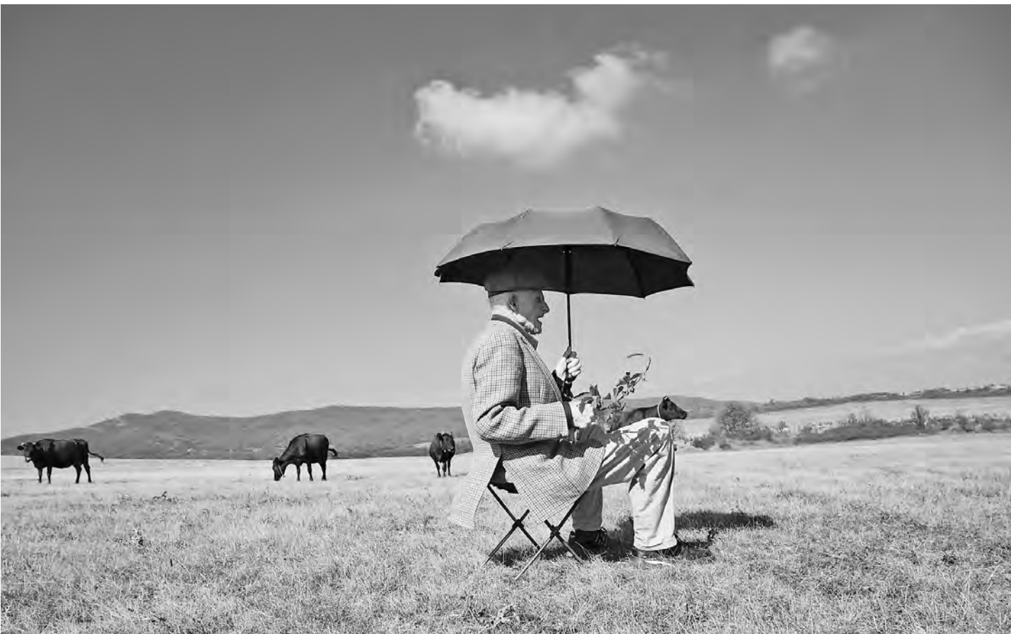
Нет плохой погоды — есть плохая одежда, говорят англичане. А мы еще добавляем: и не всегда точные прогнозы.