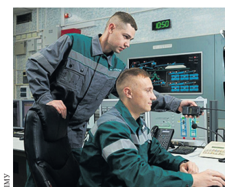
Трудоустройство на «ПМУ» — шаг в профессиональном развитии.