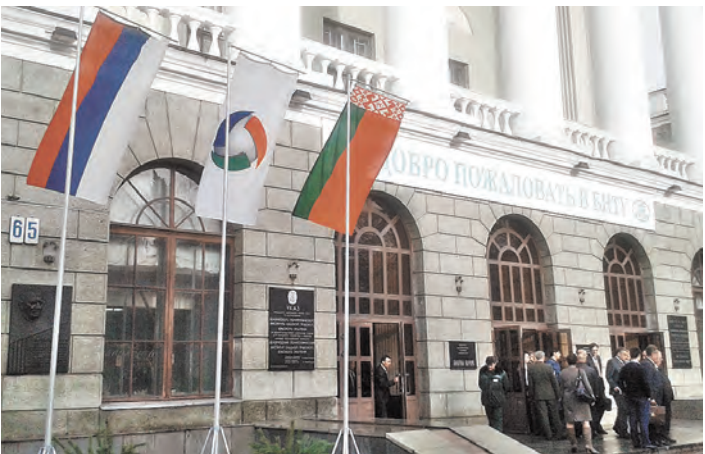
На форум в Минск приехали более 200 участников из десятков вузов Беларуси и России.

БЕЛОРУССКИЙ национальный технический университет можно смело называть международным центром инженерно-технологического образования. Именно здесь проходил четвертый форум Союзного государства вузов такого профиля.