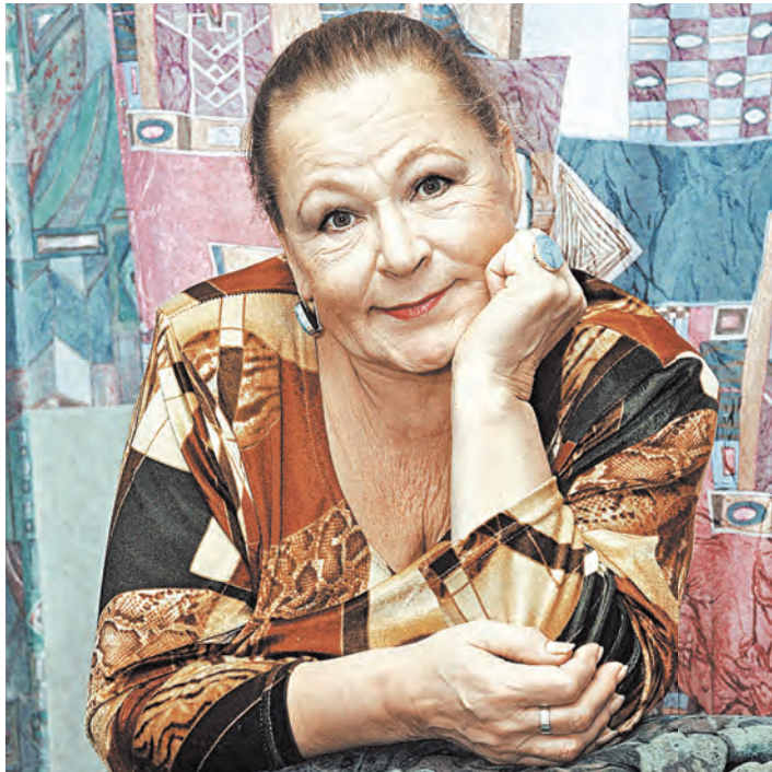
Раиса Рязанова: Я не играю цариц, королев. Играю теток, на которых мир и держится.

Подробности — в следующем номере газеты «СОЮЗ. Беларусь—Россия»