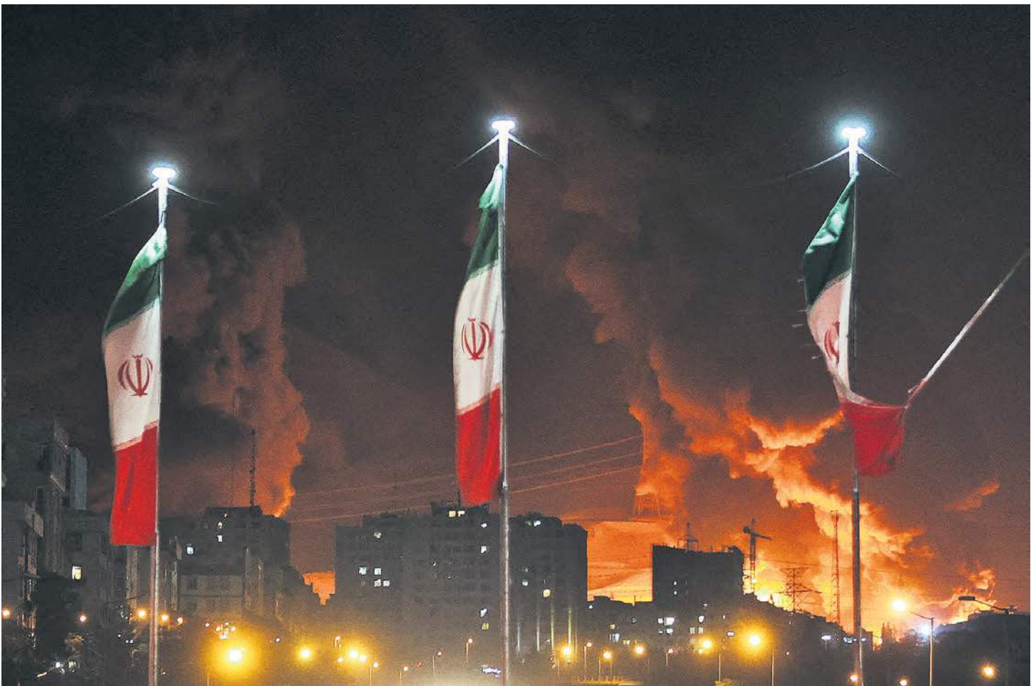
К 15 июня израильская авиация расширила список целей за счет объектов иранской энергетической и нефтегазовой инфраструктуры. На фото: пожар после удара по нефтехранилищу Шахран

Но военачальники не единственные, кто попал в израильский список целей. В нем оказались 25 иранских ученых-ядерщиков, которые, как полагают в Израиле, участвовали в разработке ядерного оружия. По дан-