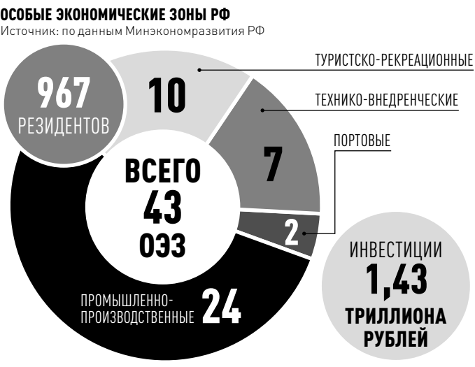
ИНФОРМАЦИЯ: РГ — СВЕТАНА ЦЫГАНКОВА / АНА ДРОБА

САНКТ-ПЕТЕРБУРГ: 2-Я СОВЕТСКАЯ УЛ., 27/2. ТЕЛЕФОН: (812) 449-65-45. E-MAIL: SPB@RG.RU КАЛИНИНГРАД: УЛ. КОПЕРНИКА, 6. ТЕЛЕФОН: (4012) 53-10-10. E-MAIL: RG@ETURE.RU АРХАНГЕЛЬСК: ПР. ТРОИЦКИЙ, 63, 3-Й ЭТАЖ, 30-Й КАБИНЕТ. ТЕЛЕФОН: (8182) 20-78-37. E-MAIL: GAZETA.ROSS@YANDEX.RU МУРМАНСК: УЛ. БОРОВСКОГО, 5/23, ОФИС 636. ТЕЛЕФОН: (8152) 60-74-24. E-MAIL: LEADER_57@RG.RU