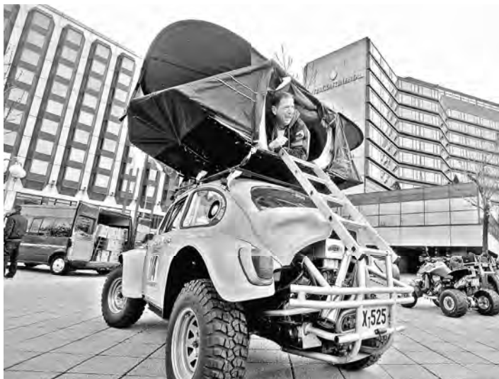
Новые кемпинги подойдут даже для самодельных домов на колесах.

Что для этого нужно сделать, рассказали представители ведомства и эксперты «Российской газеты».