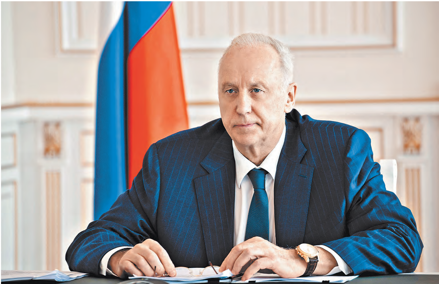
ПРЕСС-СЛУЖБА СЛЕДСТВЕННОГО КОМИТЕТА РФ