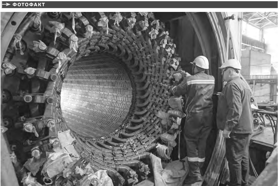
В Новосибирске все готово к старту отопительного сезона, социальные объекты начнут подключать к теплу уже 15 сентября. Перед этим энергетики провели большую подготовительную работу, в частности, на турбине первого энергоблока Новосибирской ТЭЦ-5 (крупнейшей в регионе) сделали плановый капитальный ремонт.

НА ТРАДИЦИОННЫХ осенних ярмарках посетители могут приобрести у местных производителей овощи и фрукты, мясо, молоко, сухофрукты, ягоды, грибы, орехи, варенья и соленья, мед и продукты пчеловодства. 14-15 сентября новосибирцев ждут по адресу: ул. Трикотажная, 62 (территория, прилегающая к ТЦ «Кларус»); 15 сентября — на площади Маркса; 14 и 28 сентября — в Ленинском районе на площадке у ТЦ «Континент».