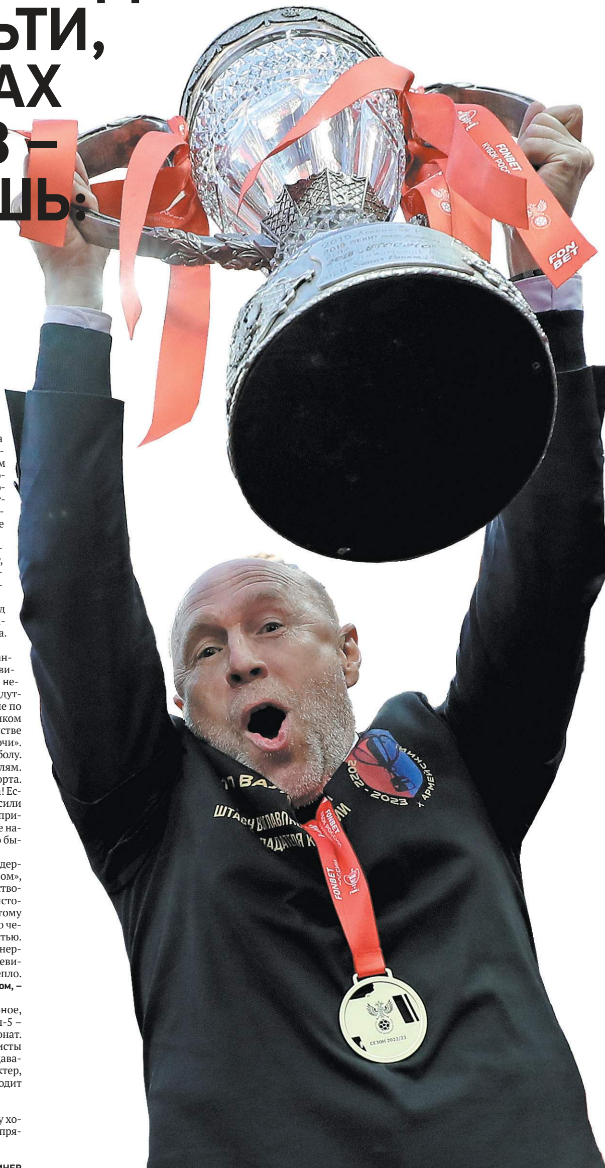
11 июня. Москва. Лужники. Суперфинал Кубка России.