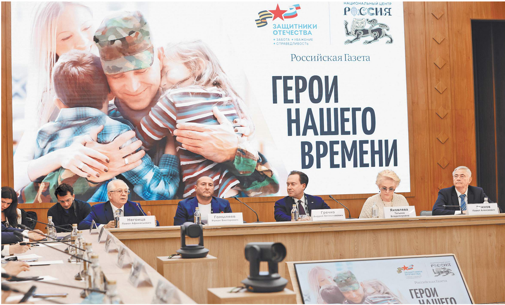
«Герои нашего времени» — видеопроект, показывающий истории ветеранов, которые возвращаются к мирной жизни.