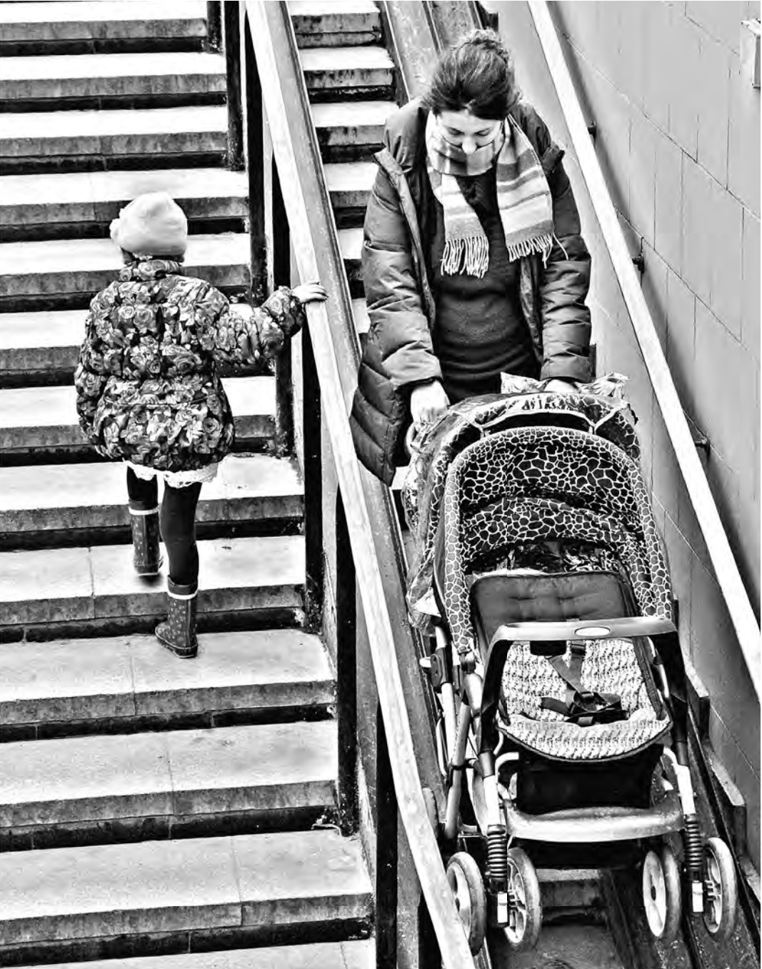
Верховный суд не позволит чиновникам опеки создавать проблемы заботливым родителям.