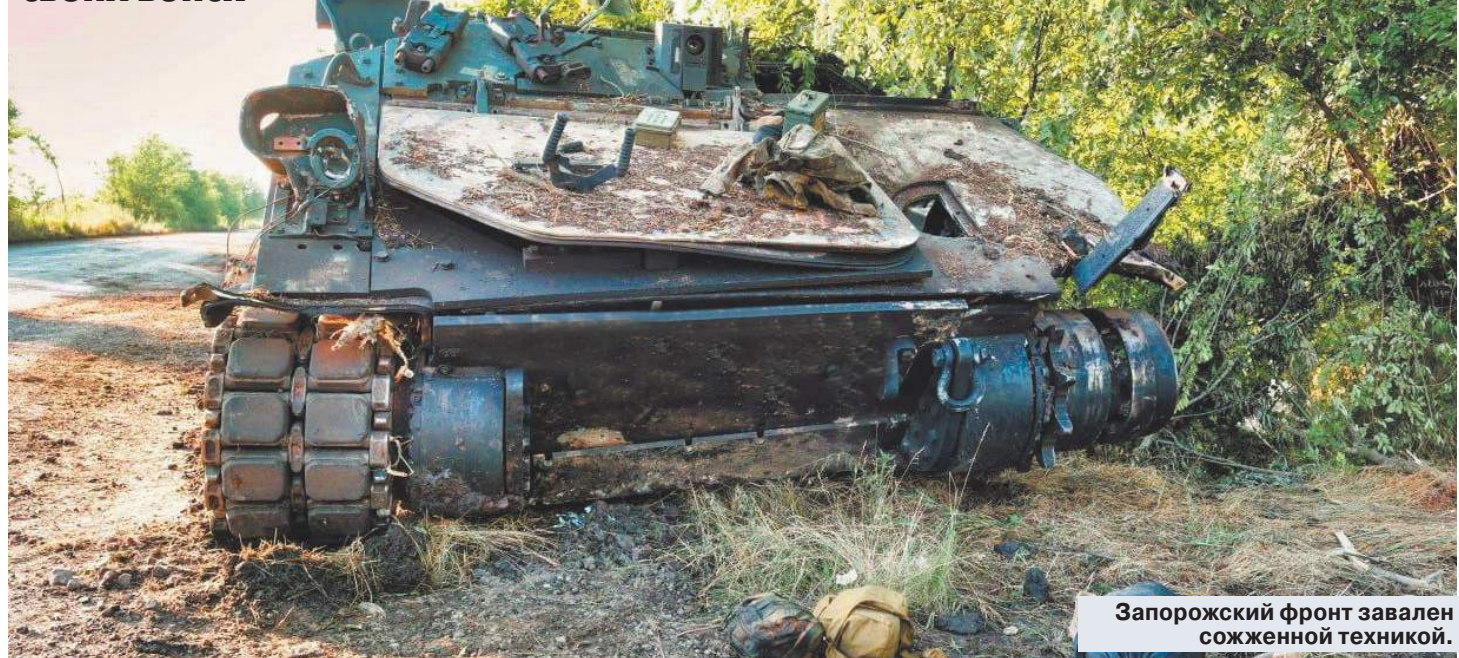
Запорожский фронт завален сожженной техникой.

Киев не считается с огромными потерями своих войск