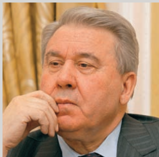
ПРЕДСТАВЛЕНО ПРАВИТЕЛЬСТВОМ ОМСКОЙ ОБЛАСТИ