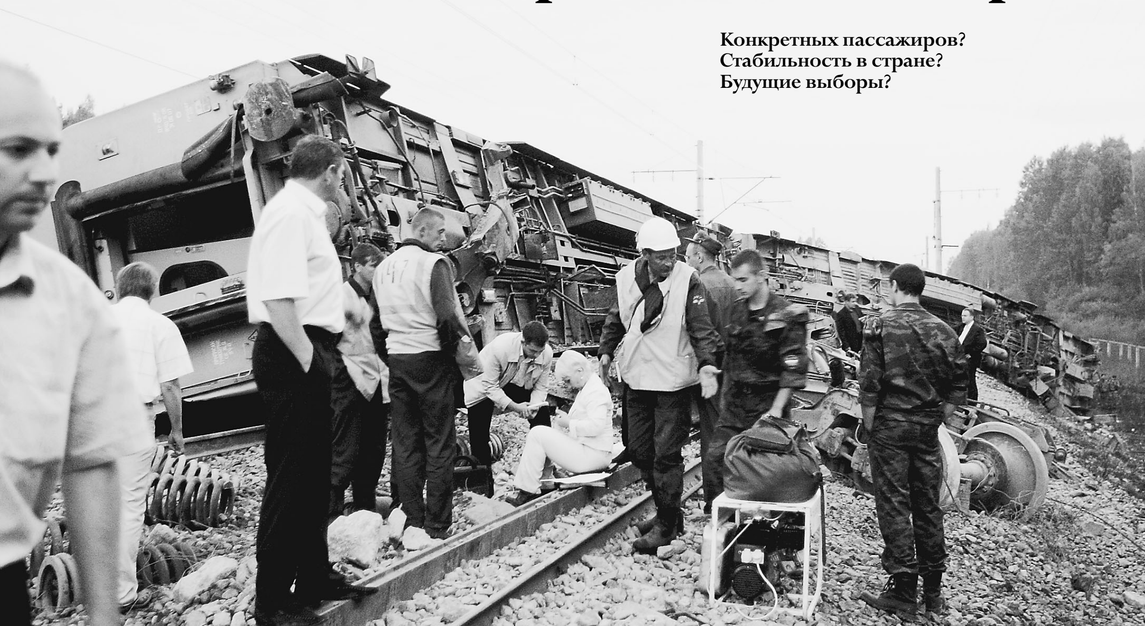
14 августа. Перегон между станциями Бурга и Красненка неподалеку от райцентра Малая Вишера. Спасатели работают на месте крушения экспресса № 166

В Россию пришла рельсовая война. Вечером в понедельник в Новгородской области на Октябрьской железной дороге, одной из самых благополучных и перспективных в стране, неизвестные подорвали бомбу под скоростным «Невским экспрессом». Состав сошел с рельсов, несколько вагонов опрокинулись. Бомба была заложена перед мостом через реку, и, по замыслу злоумышленников, вагоны должны были рухнуть с моста. Но состав проскочил, и то, что обошлось без жертв, — чудо. Теперь правоохранительным органам предстоит выяснить, кто же эти люди, готовые развязать партизанскую войну в новгородских лесах.