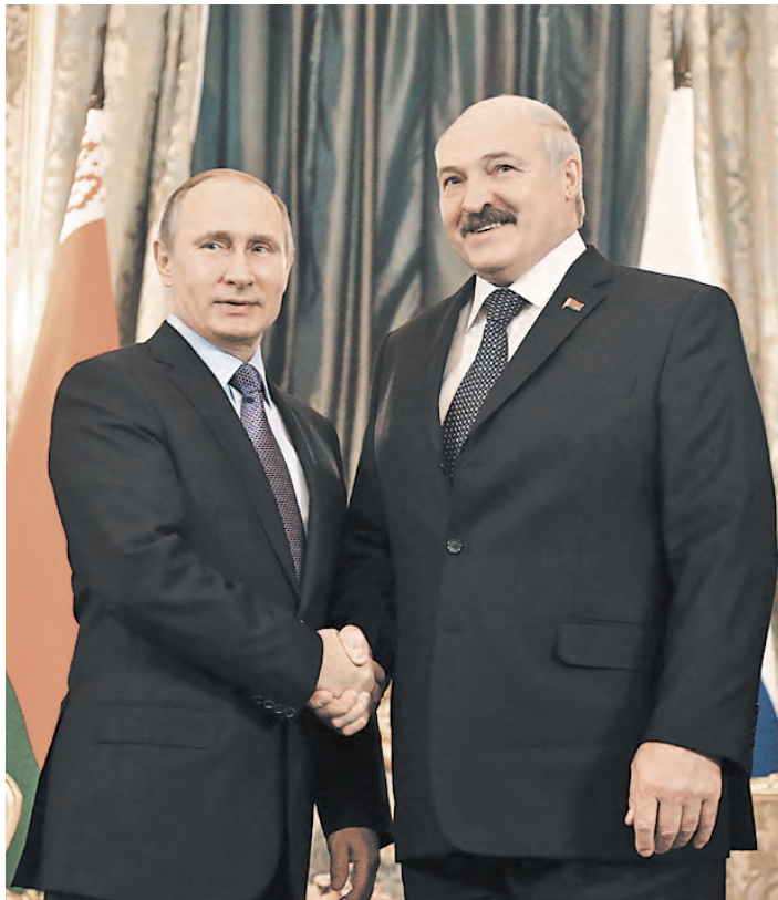
Во время встречи на высшем уровне президенты России и Беларуси обсудили в том числе вопросы, касающиеся Союзного государства.

Анонс / Что привезли корреспонденты «СОЮЗа» со старейшей в России фабрики елочных игрушек?