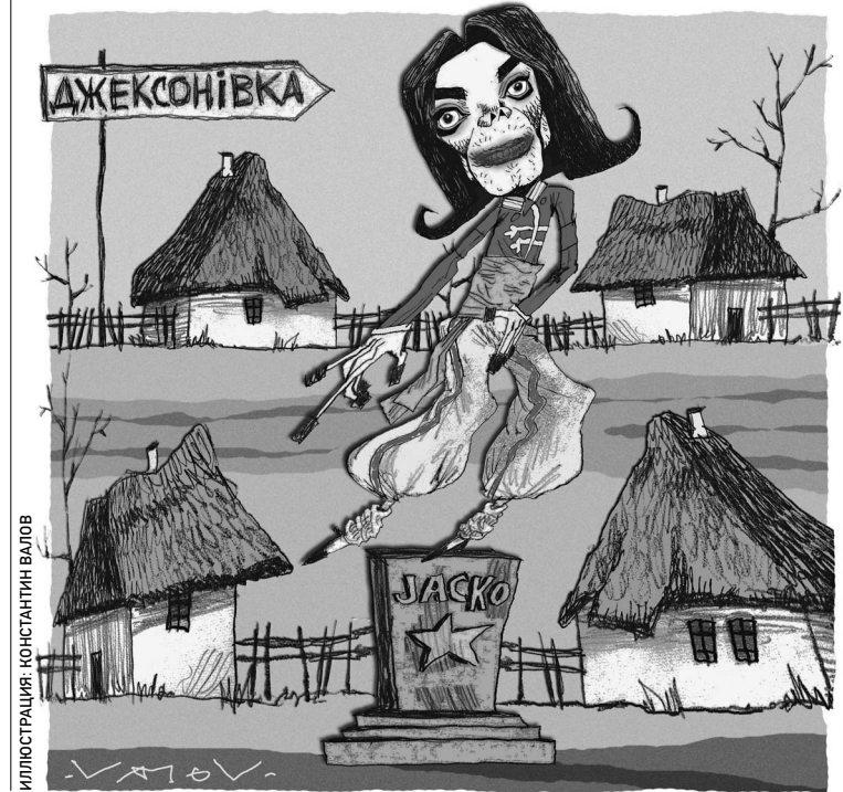
ИЛЛЮСТРАЦИЯ КОНСТАНТИНА ВАЛОВА

которые обещают перевернуть мир так, что все прежние научные революции покажутся походом в скляную лавку за долготом и веником. NBIC — это аббревиатура, которая означает сочетание в одной цепочке нано- и биотехнологий, информационных и компьютерных технологий, а также когнитивных ресурсов, нацеленных на искусственный разум. → стр. 9