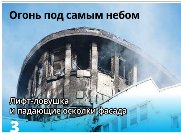
Огонь под самым небом