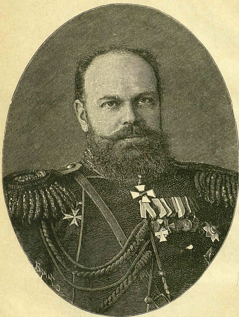
Въ Бозѣ почившій Государь Императоръ Александръ III. († 20-го октября 1894 года).