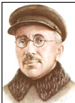
Антон Семёнович Макаренко (1888–1939)