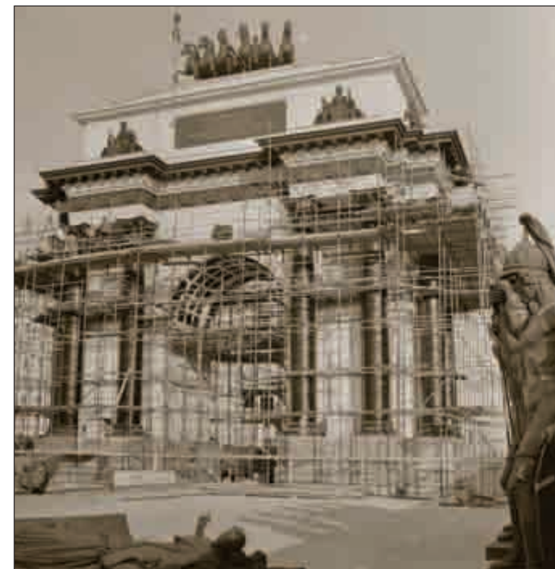
Монтаж Триумфальных ворот на Кутузовском проспекте. Лето 1968 года. Автор А. Жиликов. 1-29752