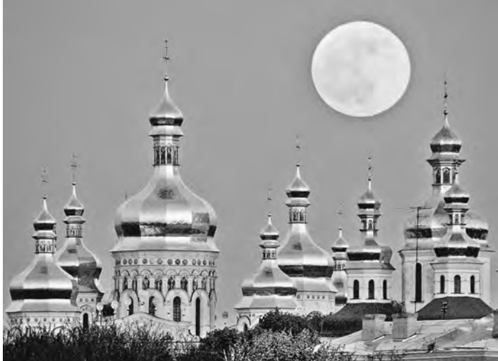
Прихожане отстояли Киево-Печерскую лавру от «защиты» митингующих.

Активисты Автомайдана (революционная кавалерия) сообщили в «Твиттере», что из Лавры вывозят святыни. Новость следовала мгновенно, тем более что накануне предстоятель канонической Украинской православной церкви Филарет