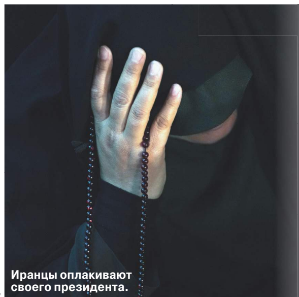
Иранцы оплакивают своего президента.