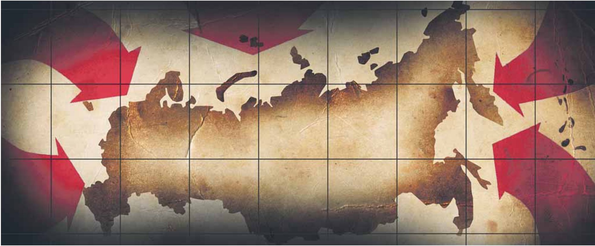
Коллаж: Андрей СЕДУХ