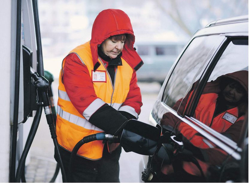
Стоимость бензина зависит не только от биржевых торгов, но и от курса рубля, мировых цен на нефть и налоговой нагрузки