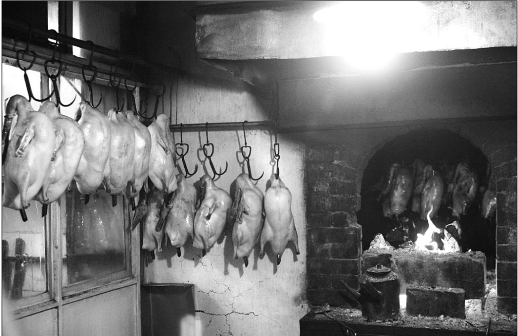
Вчера. Пекин. Один из ресторанов, в котором готовят знаменитую пекинскую утку.