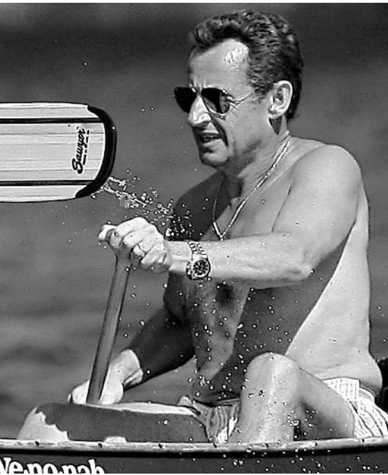
Николя Саркози настоящий (слева) и «отредактированный»

Наши коллеги из журнала «Пари-Матч» совершили профессиональный подвиг. А заодно и гражданский. Они с любовью и благоговением поработали над знаменитой фотографией, где Николя Саркози в плавках и с сыном плывет на лодке по американскому озеру во время недавнего отпуска. Снимок умело отрегулировали, убрав недостатки фигуры президента — а именно жировую складку на талии, предательски «подставившуюся» под объектив папарацци. Небольшую такую складку, невинную, не особо портящую фигуру поджарого главы государства. Но редакторы «Пари-Матч» — перфекционисты. Они хотят, чтобы фигура лидера нации была не просто спортивной, а безупречной. И провели «обезжиривание». Вот только конкуренты оказались бдительными и поймали «фотохудожников» за руку. Вспыхнул нешуточный скандал. Почему эта история так всколыхнула общество? Почему недавние телекадры из Тувы, на которых Владимир Путин с голым торсом играет собственными мускулами, до сих пор активно обсуждается и в прессе (в том числе западной), и в интернете? Может быть, мы наблюдаем тенденцию нового времени, когда тело президента или премьера становится аргументом в большой политике? Продолжение темы → стр. 4