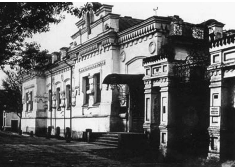
Так выглядел Ипатьевский дом, где была уничтожена семья последнего российского императора

— Искали при помощи шупа. Миноискателем было бесполезно искать, так как захороненные люди были раздеты, металла при них не было. → стр. 2